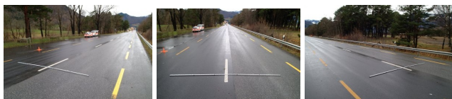
Messbilder von links, mittig und rechts mit einer 5m Nivellierlatte für die Maßstabsinformation

Bei Verkehrsunfällen in Ortschaften, d.h. Unfälle, die sich nur über kleine Distanzen erstrecken, werden hauptsächlich von der Straße aus photographiert. Dabei sollte die Kamera aber so hoch wie möglich gehalten werden. Die meisten Polizisten verwenden dazu eine kleine Leiter oder halten die Kamera über Kopf. Die gesamte Szene wird dabei systematisch photographiert: Je ein Bild von linken Straßenrand, aus der Mitte und vom rechten Straßenrand: